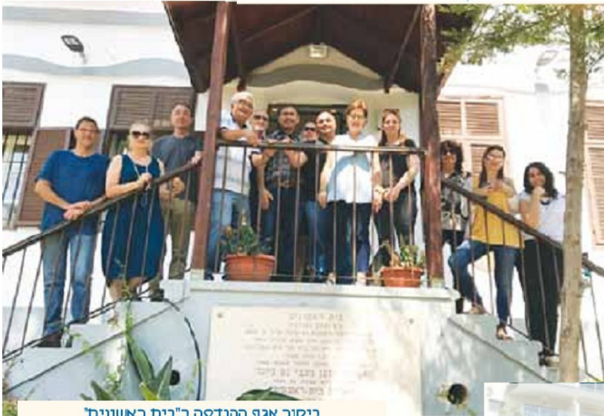
ביקור אגף ההנדסה ב"בית ראשונים"

כך מספר עדאל: "לאחר כשעה המתנה, הבחנתי במשאית העושה את דרכה לכון