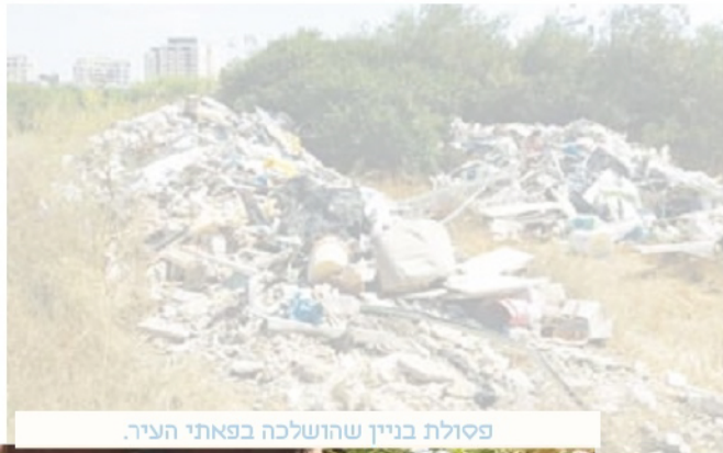
פסולת בניין שהושלכה בפאתי העיר.